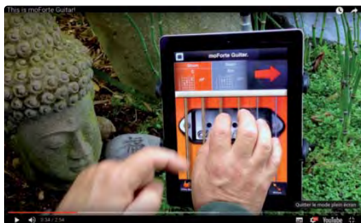
Deux applications réalisées en Faust pour jouer de la musique : GeoShred et Moforte Guitar. www.moforte.com

d'enseignement est l'université Jean Monnet de Saint-Étienne dans le cadre de cours en licence et master. Des cours plus ponctuels ont lieu à l'Ircam (dans le cadre de la formation « Acoustique, traitement du signal, informatique, appliqués à la musique - ATIAM ») et à l'École nationale supérieure d'électronique, informatique, télécommunications, mathématique et mécanique de Bordeaux.